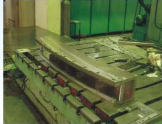
निर्माणाधीन सेप्टम चुम्बक