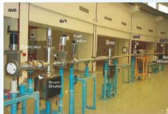
सिन्क्रोट्रॉन के फ्रंट एंड का आदि प्ररूप